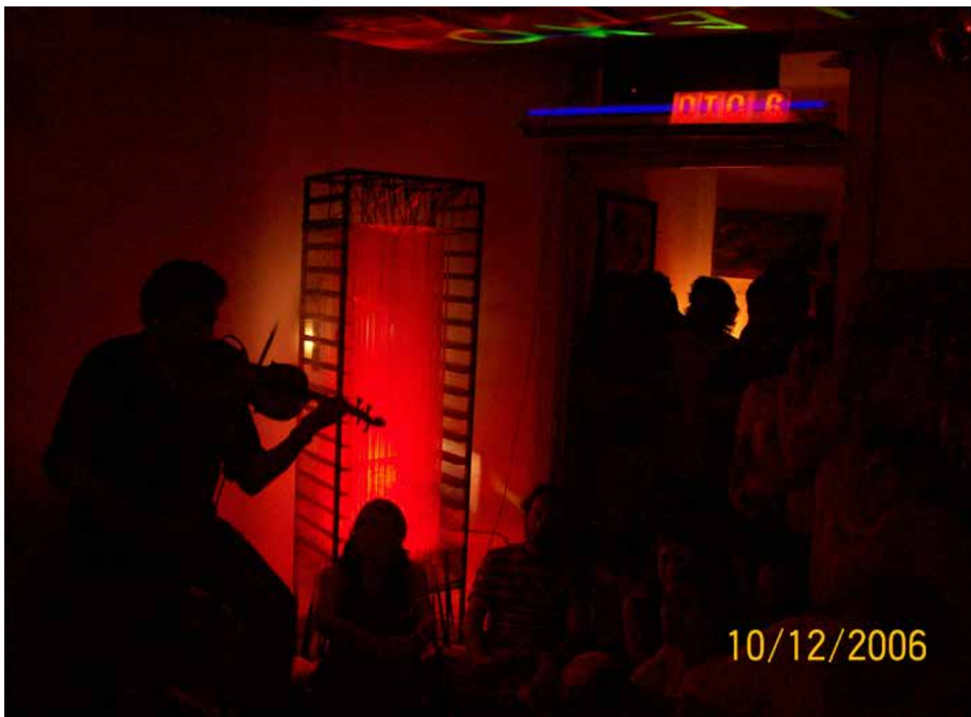
"No tiene goyete" - IV Exhibición de arte independiente; Dto 6, Córdoba, Argentina, 2006. (Primer morada de Dto 6)