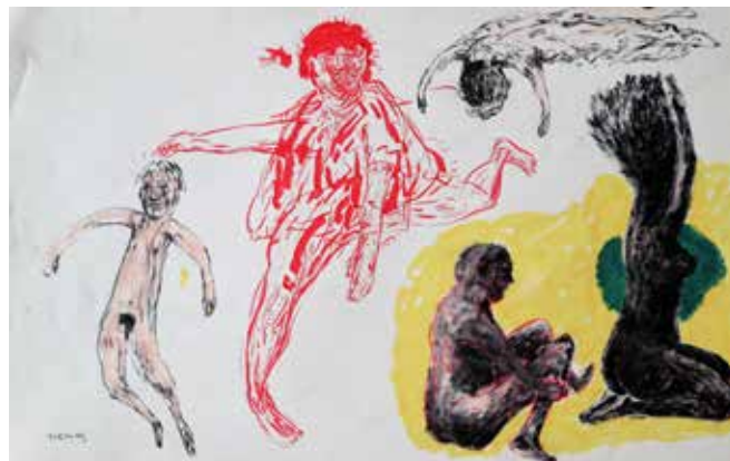
Rubén Menas - “S/t” 2020 - Mixta s/papel - Medidas variables (políptico)

perceptivo del mismo, actúa como una identidad incontrollable que ha eliminado a su autor y ha asumido vida propia. Vemos refugios, espesura y escondrijos. Aquí, la naturaleza y (el dibujo), como un monstruo inasible, reaparece y subyuga. Es el deseo imperioso de la artista: la naturaleza ha tomado venganza.