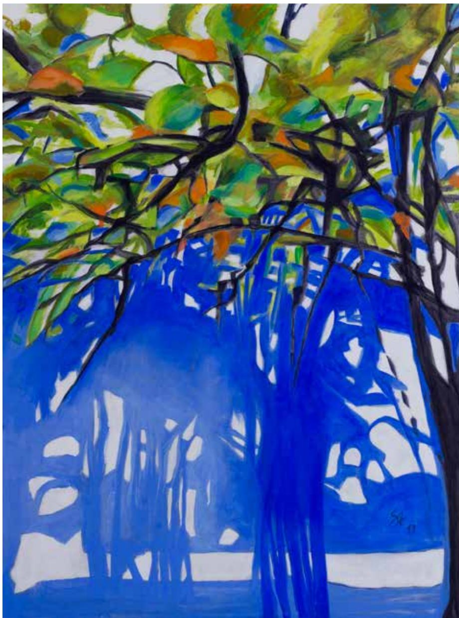
Otoño del monte - 2019 - Acrílico y carbonilla s/tela - 161 x 120 cm.