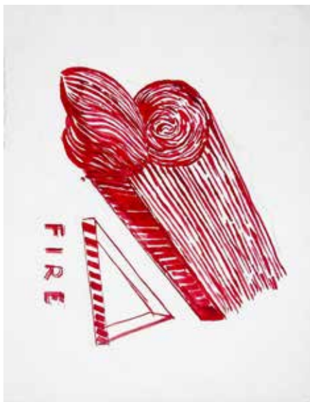
Juan Longhini - "S/t" 2020/2021 - Tinta china s/papel - 40 x 30 cm.