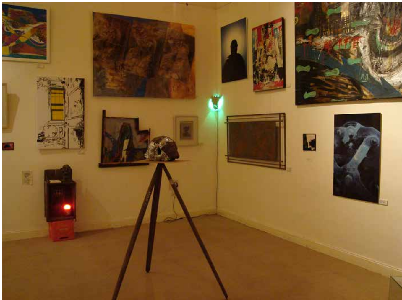
"Llegando los monos" - Exhibición colectiva de artes y pensamientos autónomos, Centro de Arte Contemporáneo "Chateau Carreras", Córdoba, Argentina, 2007 - Ph cortesía Dto 6