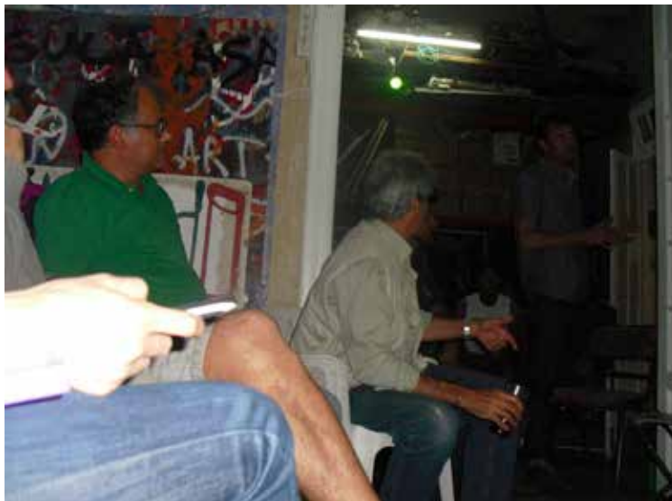
Conversatorio “ La frontera como método ” - por el Dr. en Filosofía Sandro Mezzadra (Bologna, Italia) en Dto 6, Córdoba, Argentina, 2013. (Morada actual de Dto 6)