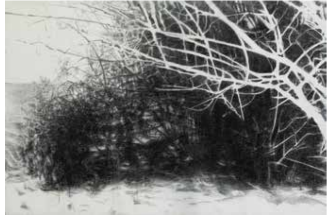
Escena del Monte - 2019 - Acrílico y carbonilla s/tela - 100 x 150 cm.

el guiño conceptual. Para tantos de nosotros, sus espectadores, sus obras serán también un reingreso a nuestras exploraciones infantiles, cuando despreocupados y carentes aún de muchas categorías de belleza, nos permitíamos descubrir mundos en ese contacto cercano, casi íntimo, con paisajes naturales que para otros eran un despojo. A contrapelo de las construcciones más convencionales del paisaje bidimensional, que se centran en la superficie visible, Althabe agacha la mirada y observa el suelo con la fascinación de quien recorre un terreno nuevo y encuentra allí el tesoro de lo viviente. Mira a través de las ramadas aceptando y celebrando el tamiz que la naturaleza le ofrece y, desde allí, se permite el asombro, génesis (tal vez), de su poesía visual.