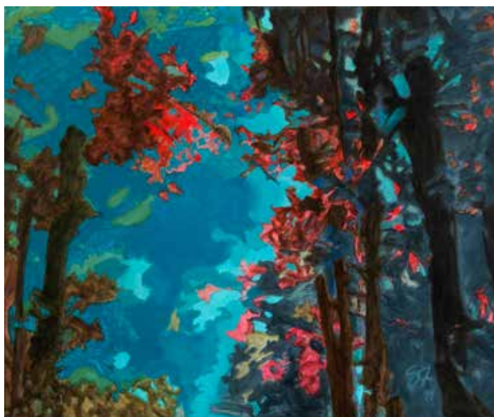
Invernal - 2019 - Acrílico s/tela - 70 x 100 cm.