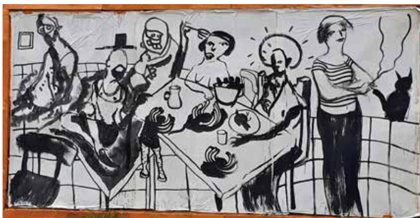
Carbonillas Proyeckt - "S/t" 2021 - Acrílico s/papel - 200 x 400 cm.