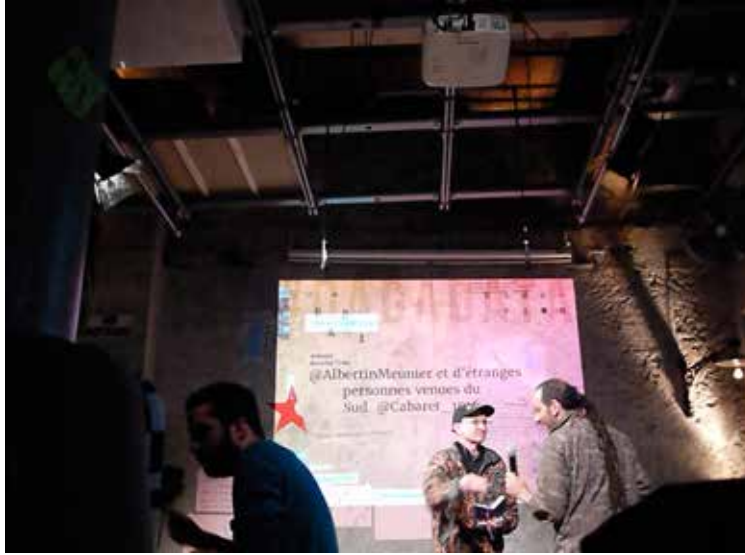
“Le Grand Dadá Manifesto” - Participación de Dto 6 en la escritura del Nuevo Manifiesto dadaísta multimedia por los 100 años de Dadá, Cabaret Voltaire, Zurich, Suiza, en el marco del Descalabre tour 2016