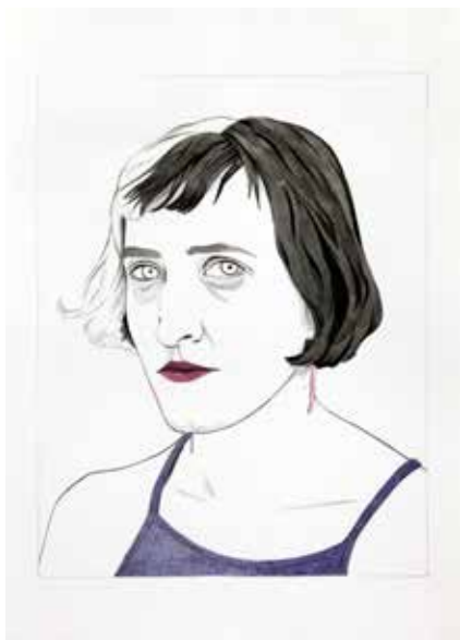
Majo Arrigoni - Serie "Mujeres" 2020 - Lápiz y tinta s/papel - 105 x 138 x 2 cm. (Políptico)