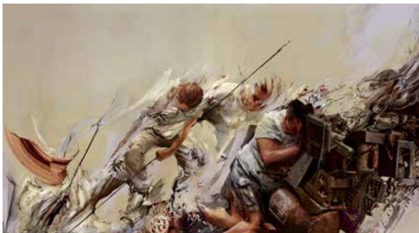
Lucas Aguirre - "Viejos problemas, nuevas soluciones" 2020 - Mixta s/lienzo - 80 x 140 cm.