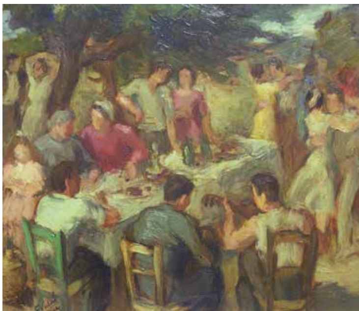
Francisco Vidal Pic-nic 1944 Óleo s/hardboard 35 x 40 cm Colección MEC