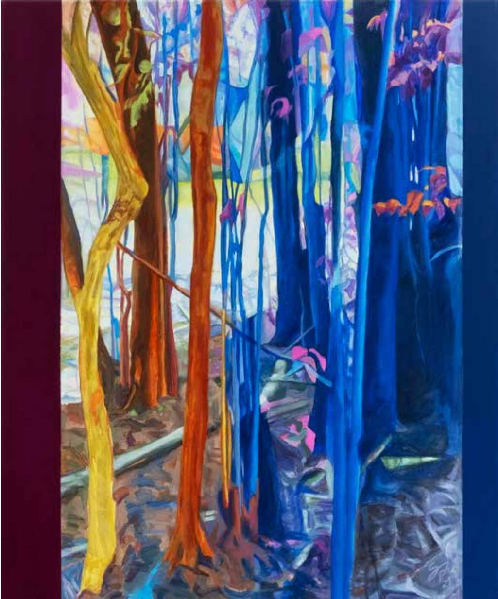
Allí sucede - 2021 - Acrílico s/tela - 100 x 80 cm.