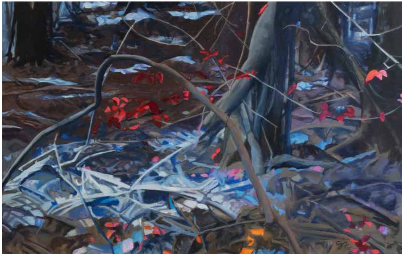
Hojas rojas - 2020 - Acrílico s/tela - 100 x 150 cm.