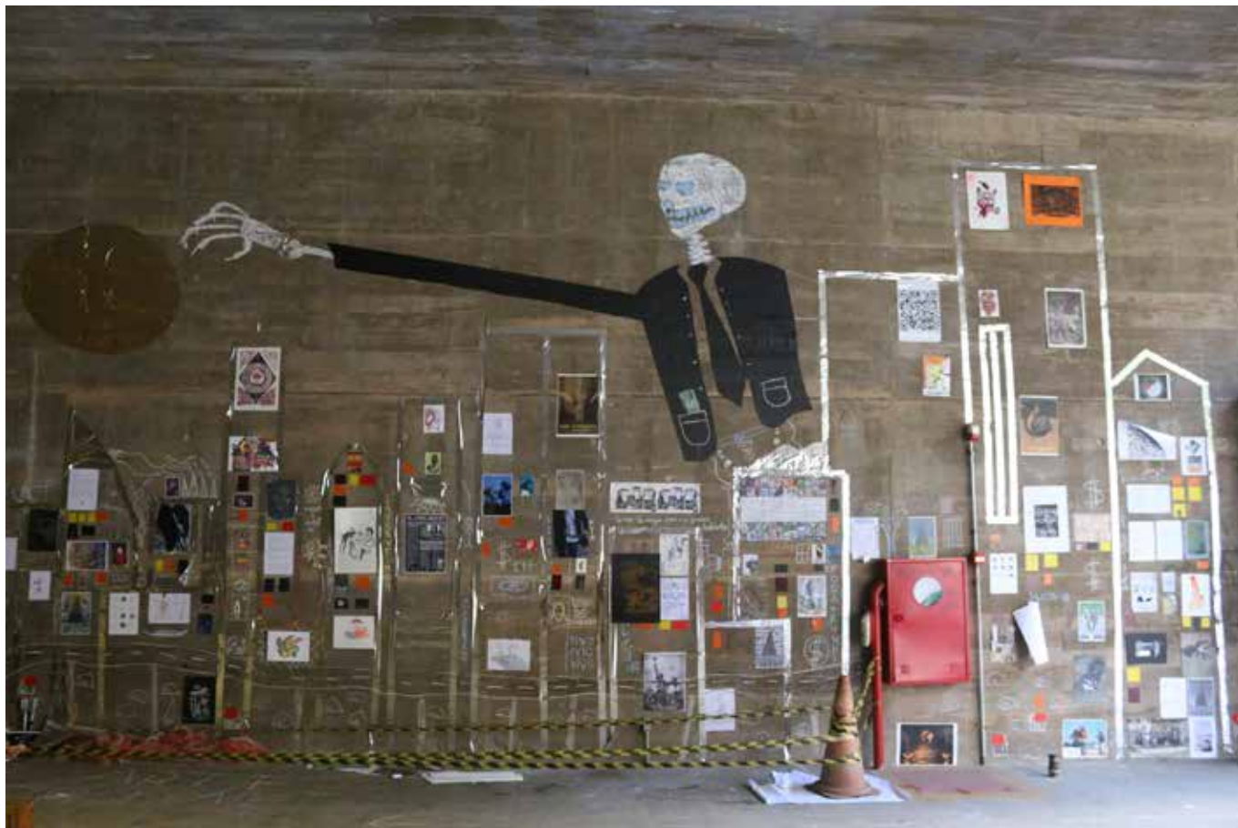
“Ta que Pela” - Exhibición de artes y pensamientos contemporáneos en Praça das Artes, Teatro Municipal de São Paulo, Brasil, en el marco del Descalabre tour 2016, noviembre 2016