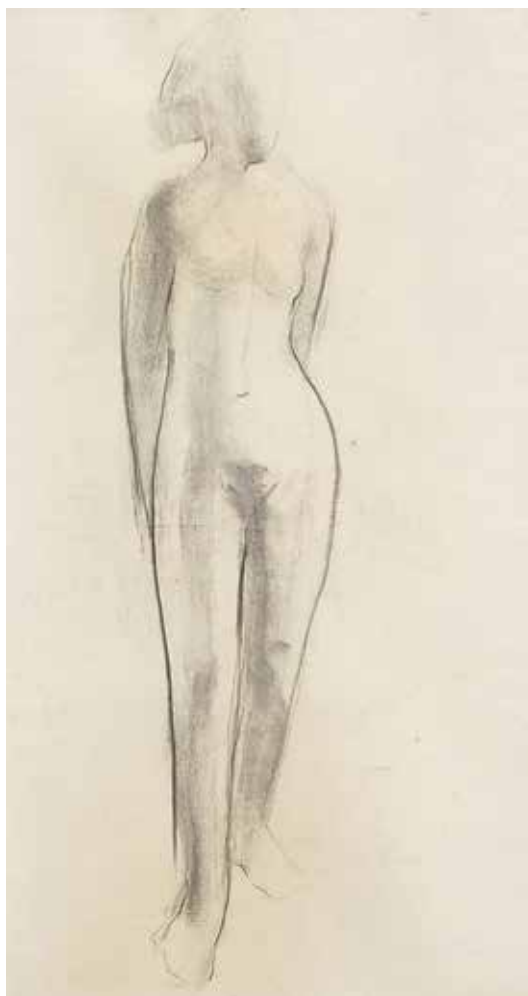
Clara Ferrer Serrano Estudio de figura femenina s/f Carbonilla s/papel 44,5 x 23 cm Colección MEC