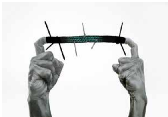
Marisol San Jorge - De la serie "Elegía brillar y Dios" 2019 - Esmalte en aerosol, tinta china y lápiz s/papel - 66 x 96 cm.