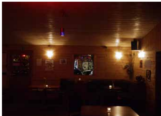
“Der Sturm” - Sound & Vision, exhibition of contemporary art; Banja, Berlín Kreuzberg, Alemania, en el marco del Descalabre tour 2016