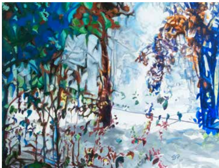
Contraluz del monte - 2020 - Acrílico s/tela - 100 x 120 cm.