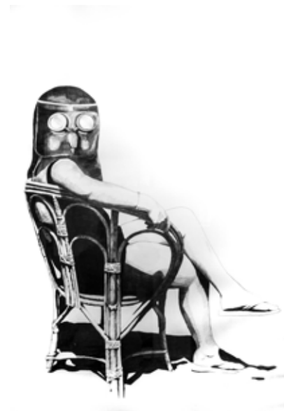
Lucía Contato - "La espera" 2019 - Lápiz s/papel - 150 x 100 cm.

El paisaje de Yiyi Etchemendy se dice anclado en la memoria, que lo aloja en un punto que está más allá de la consciencia. En ese "paisaje" esta la construcción de su propia identidad, sus anhelos y su transitar. Lo visible es lo oculto y su trabajo, una construcción afectiva. Mientras que en la propuesta de Córdoba el monte se revela como un cuerpo físico que se lo traga todo, la obra de Etchemendy apunta a la fragilidad del cristal gastado de un espejo.