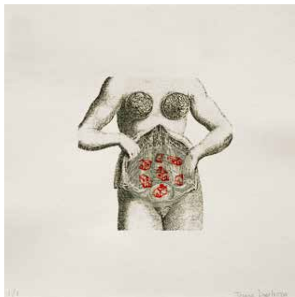
Tercer Premio Categoría Estudiantes Triana Inostroza (Argentina)

"1982" - 2019 - Escaneografía y collage digital - 18 x 18 cm.