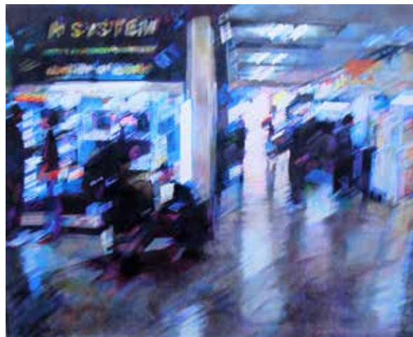
Ariel Archina - "La transa" 2016 - Lápiz de color s/papel - 150 x 175 cm.

signos, por un sistema operativo autónomo, hasta convertirse en una realidad paralela.