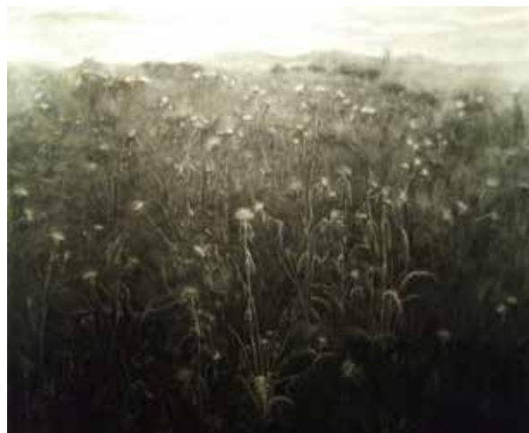
Yiyi Etchemendy - “S/t” 2019/2020 - Mixta s/lienzo - 140 x 170 cm.

En la obra de Daniela Córdoba , el paisaje más que fenómeno